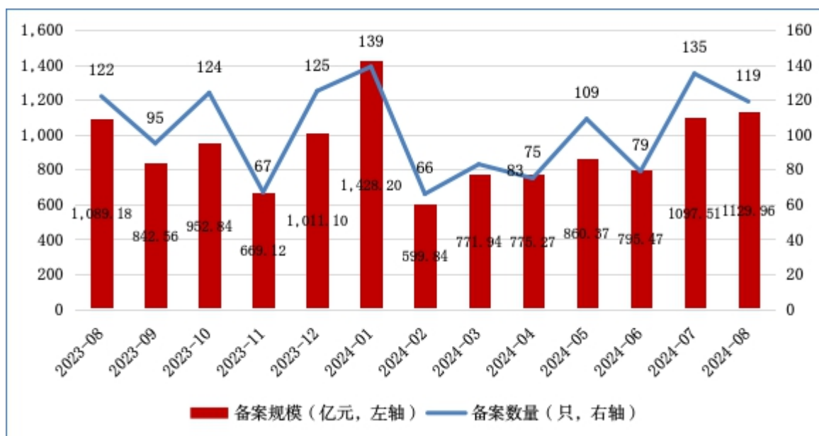
图1 ABS月度备案数量及规模情况

2024年8月，资产支持专项计划 [1] （以下简称ABS）新增备案119只，新增备案规模合计1,129.96亿元（见图1）。其中基础设施公募REITs所投ABS [2] 备案1只、19.74亿元。此外，新增备案规模前三的ABS基础资产分别为：小额贷款债权、融资租赁债权、应收账款，备案规模分别为314.36亿元、235.51亿元、223.91亿元（见表1）。