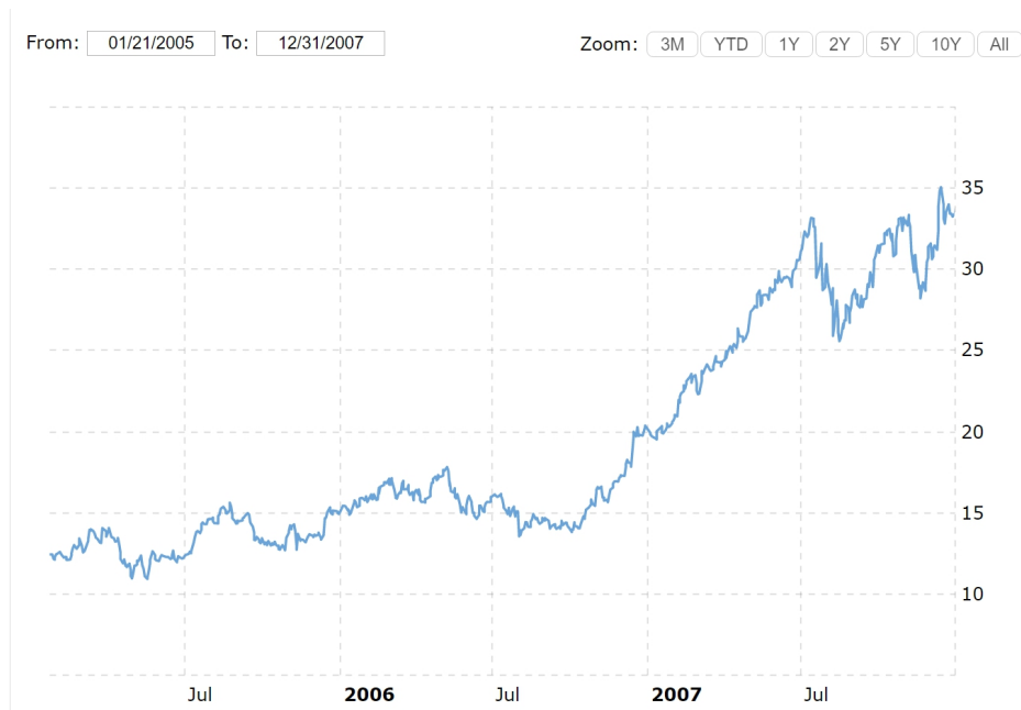
图 2 2005 年至 2007 年塞拉尼斯股价走势图

从 2002 年启动对塞拉尼斯的收购事项沟通，2004 年完成收购，再到 2007 年完成退出，五年左右的时间里，黑石以 6.5 亿美元的自有资金出资，撬动了价值 38 亿美元的交易，获得了约 34 亿美元的净利润。黑石对塞拉尼斯的收购，成为美国并购基金发展史中的一个经典案例。